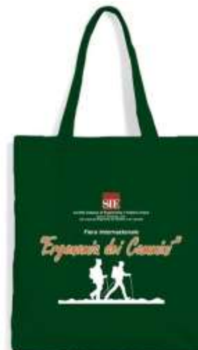
Offerta da SIE